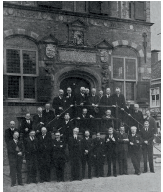
Het Friesch Godgeleerd Gezelschap bij de viering van het eeuwfeest in 1938 voor het raadhuis te Franeker

van de leiders van de Badense school van het neokantianisme, die de historische beschouwing aan de invloed van de natuurwetenschappen zocht te onttrekken, is opgenomen in deel 1 van zijn Verzamelde Werken.